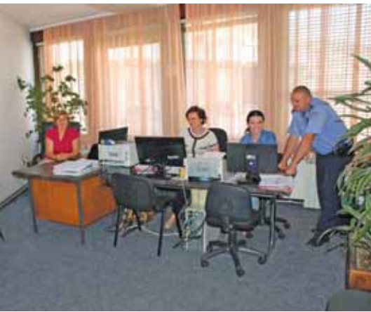
Сарадња суда и ПУ Нови Пазар