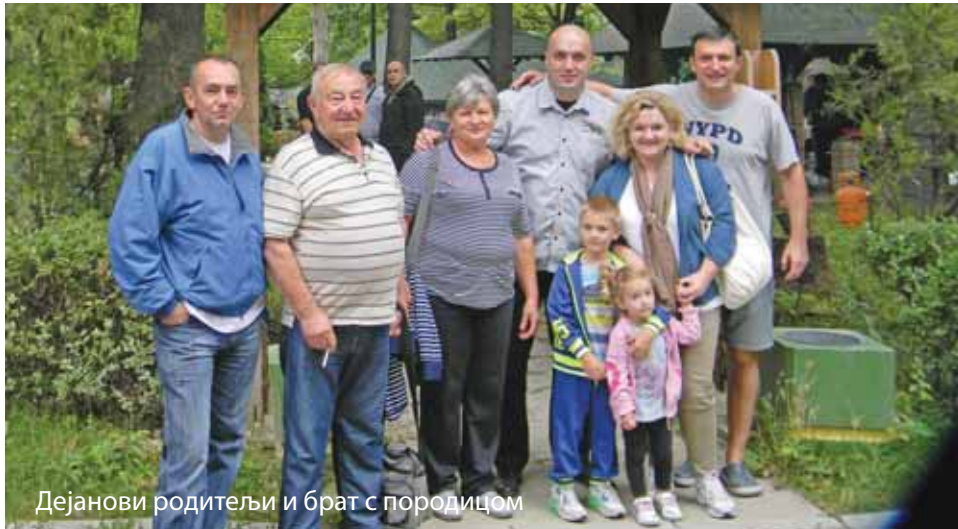
Дејанови родитељи и брат с породицом

Такмичење је окупило око две стотине полицајаца, док се једанаест екипа надметало у пецању. Трећу годину заредом прво место освојила је екипа ПС Чукарица, која је уловила највећу рибу. Прва екипа Полицијске бригаде била је друга, а ПС Лазаревац трећа. Захвалнице су добили сви учесници, међу којима и Биро за сарадњу с медијима и редакција часописа „Полиција данас“.