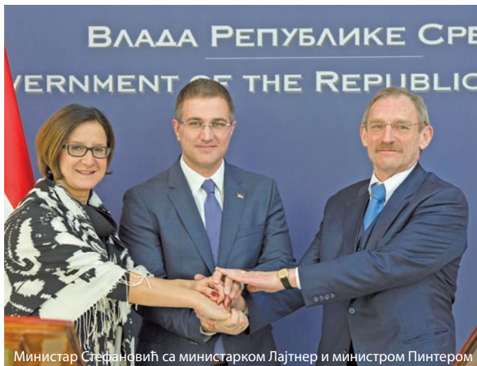
Министар Стефановић са министарком Лајтнер и министром Пинтером

Тако је Влада Србије оформила Комисију за праћење безвизног режима путовања у ЕУ, у којој седе представници свих релевантних др-