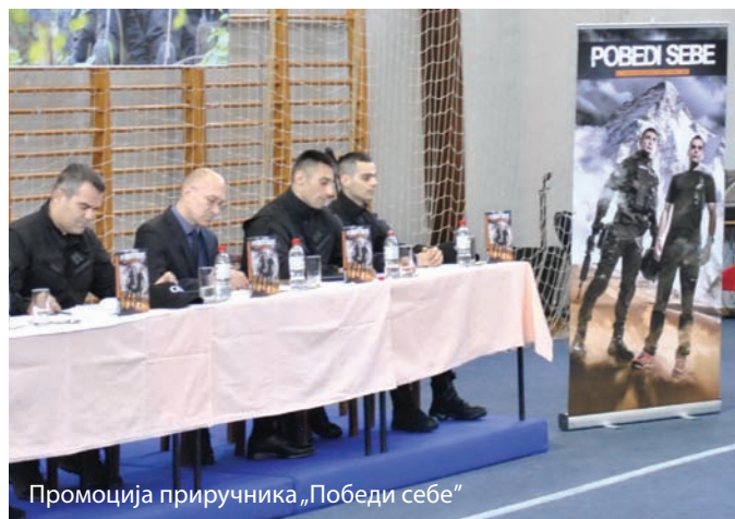
Промоција приручника „Победи себе“

Јединствени спортски приручник, књига „Победи себе“ је богато илустриран бројним фотографијама правилног извођења вежби, говори о системима тренинга спортиста и унапређења њихове психофизичке