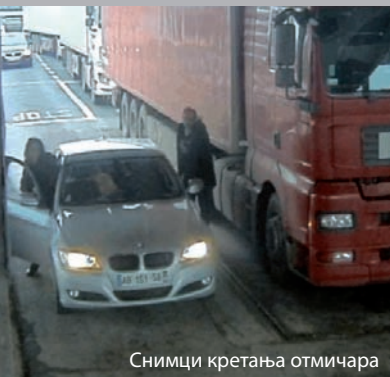
Снимци кретања отмицара