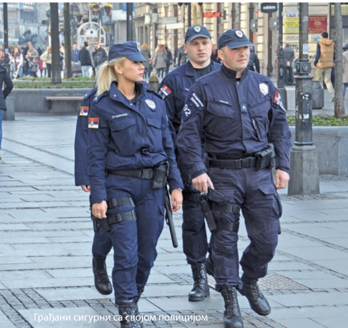
Грађани сигурни са својом полицијом

Основни задатак јесте да грађани добију ефикасну и одговорну полицију, која их штити и која није корумпирана