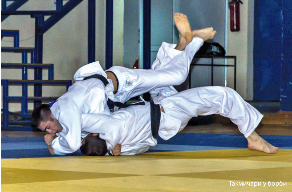
Такмичари у борби

Уз велика одрицања и труд успевају да одрже изузетан ниво резултата и да буду равноправни противници